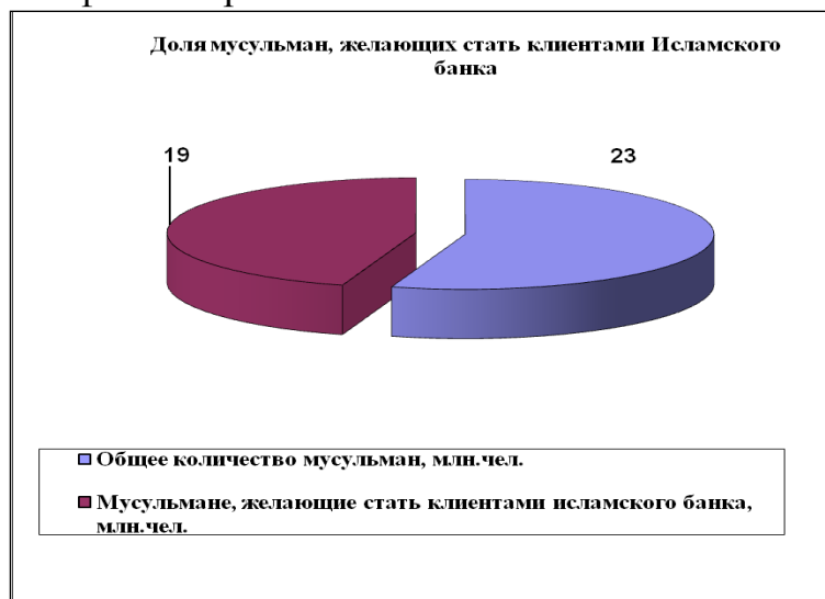
Рис. 2. Доля мусульман, желающих стать клиентами исламского банка в России существует достаточно широкая потенциальная клиентская база для исламского банкинга.

Учитывая специфику организации и учета исламских финансов, в скором времени в нашей стране возникнет потребность в кадрах для исламского банкинга. В этой связи актуальным является подготовка специалистов в области финансов и кредита, знающих основы шариата, обязательно учитывающих нормы ислама при ведении финансовых операций.