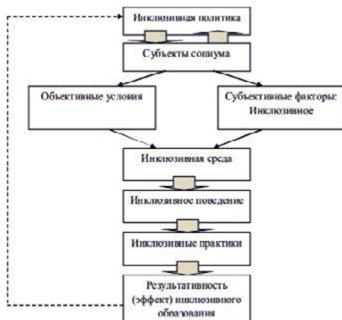
Рис. 1. Социологическая модель: Инклюзивное образование как система

способствующие реализации инклюзивного образования (см. рис. 1).