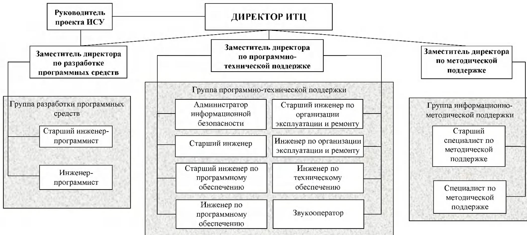
Схема организационной структуры информационно-технического центра